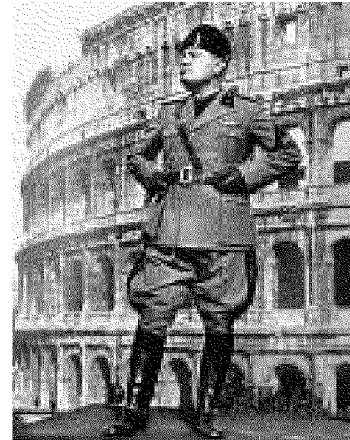
COPERTINA La copertina della "Domenica del Corriere" del 1921. Sopra, Mussolini e il Colosseo