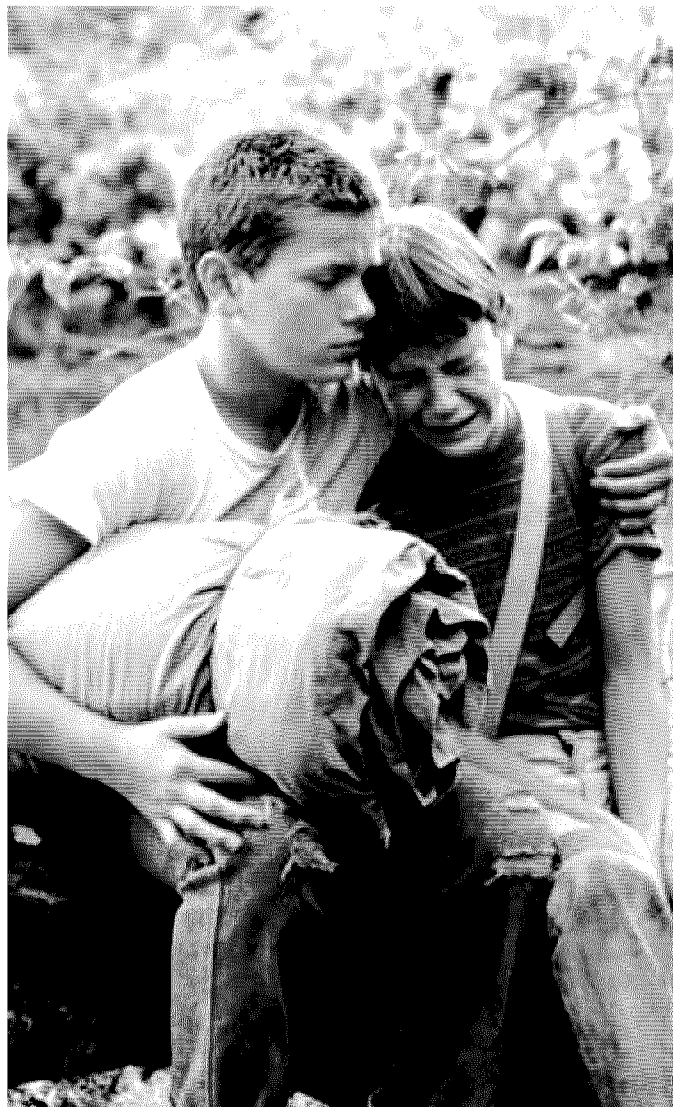
I protagonisti del film "Stand by me"